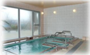
豊かな自然を眺め、快適なバスタイムを…