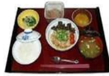
上写真はイメージです